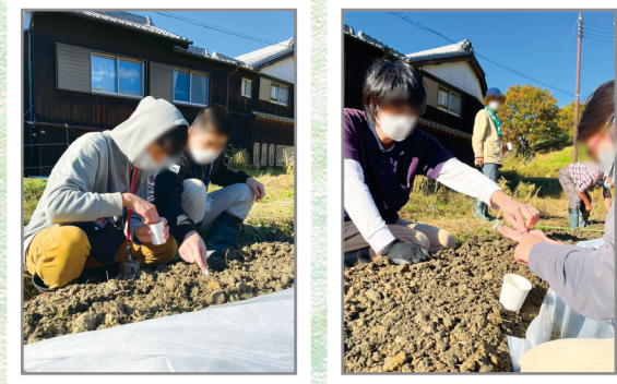
2人1組でルッコラと大和真菜の種まき作業